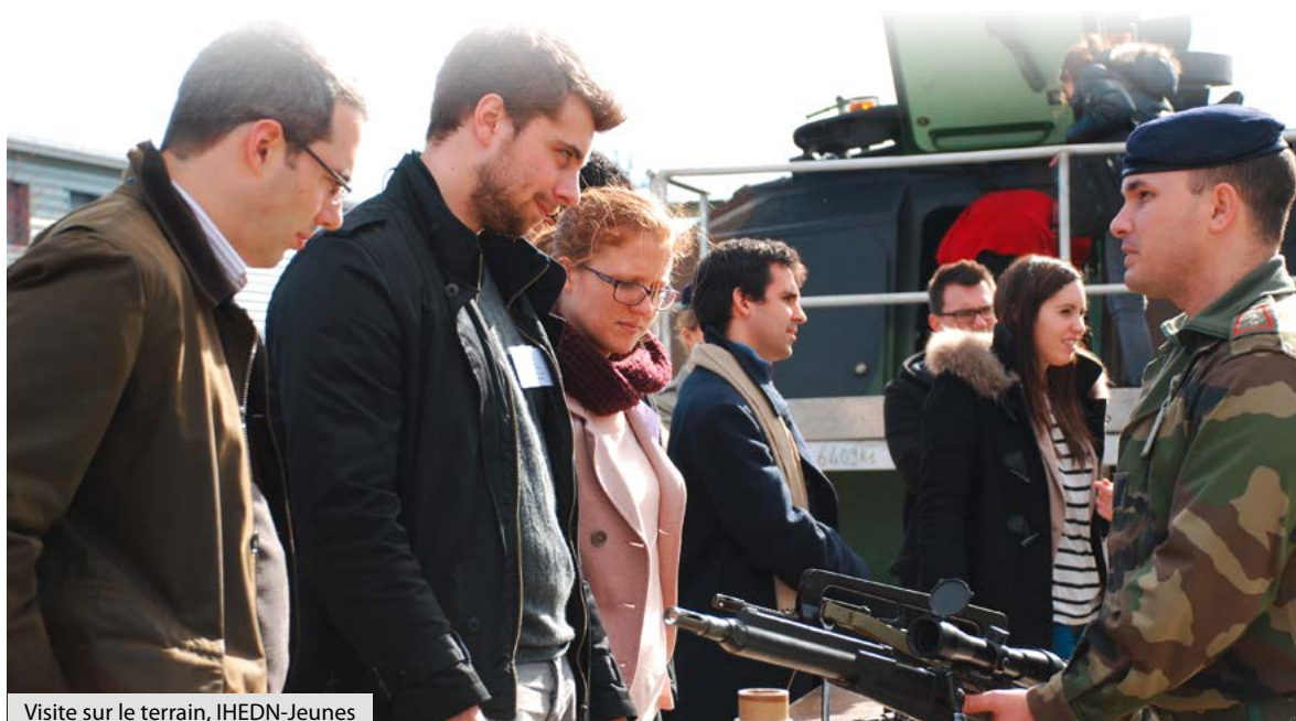
Visite sur le terrain, IHEDN-Jeunes

De nombreuses raisons objectives peuvent rendre compte de ce déséquilibre. Le secteur de la défense ne s'est féminisé que lentement et très tardivement en France, en particulier dans les armées : ces contraintes démographiques expliquent que l'accès des femmes aux postes de responsabilité y sera