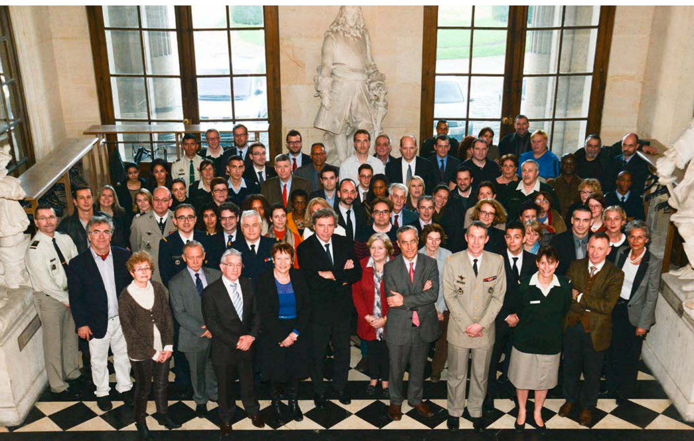
Le personnel de l'IHEDN

Enfin, une attention particulière sera portée aux questions de sécurité qu'il s'agisse des activités, notamment les déplacements des sessions à l'étranger, ou du fonctionnement de l'institut avec en particulier la sécurité des systèmes d'information.