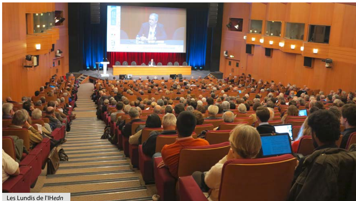
Les Lundis de l'IHedn

À l'horizon 2020, l'IHEDN souhaite accorder une attention plus systématique aux personnalités issues du monde académique, qu'il s'agisse des maîtres de conférences, des professeurs d'université, ou des chercheurs du CNRS, très peu représentés à ce stade, du moins dans les sessions nationales (les sessions régionales apparaissent en effet plus avancées dans la recherche d'une relation harmonieuse entre le monde de la défense et le monde de l'enseignement).